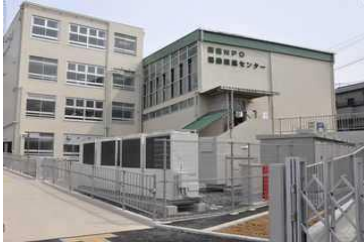
(新宿NPO協働推進センター外観)

新宿NPO協働推進センターでは、社会貢献活動に携わる皆様にお役にたつ、NPOの基礎を学ぶ講座を開催いたします。今回の資金関係第IIシリーズではNPO活動についての資金集めについてまとめて学びます。